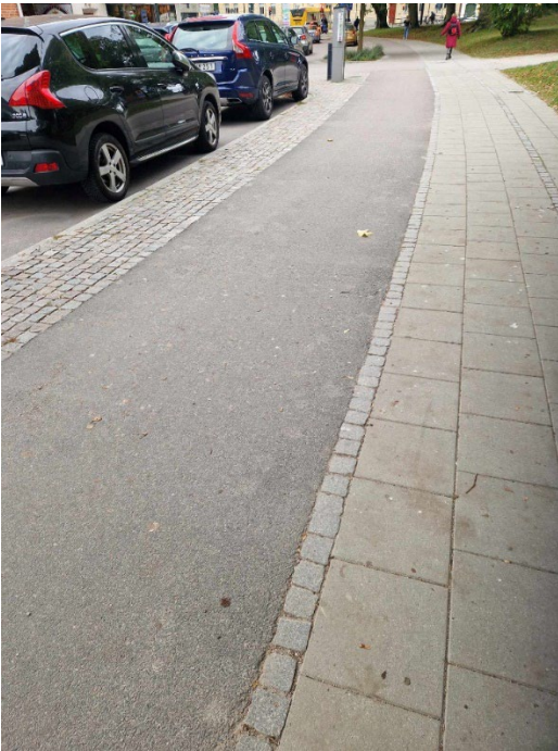
Billede 3: Eksempel på fortov og cykelsti i niveau