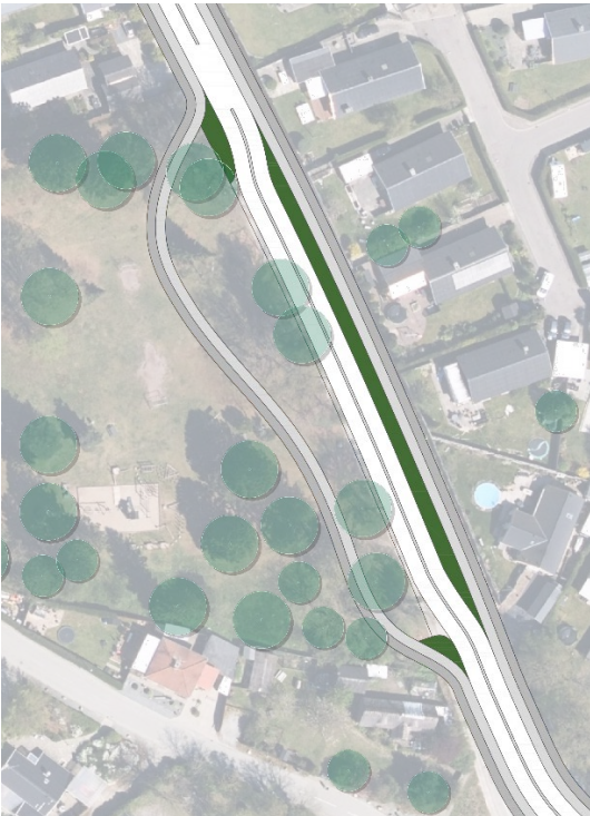
Illustration af vejforløb og omgivelser ved Risingeparken

For at vejen kan forskydes og hastigheden blive dæmpet, så flyttes cykelsti og fortov i sydlig retning ind i Risingeparken.