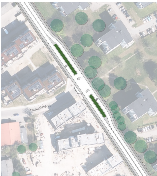
Illustration af vejforløb og omgivelser ved Torbenfeldvej

Der har tidligere været en parkeringsplads til busser og lastbiler på Vejlegårdsvej ud for Torbenfeldvej. Det gør, at der er plads til at forskyde vejen ind mod Amalieparken og derved gøres plads til en midterhelle med beplantning. Det gør også, at der bliver en krydsningshelle for de bløde trafikanter, så de kan krydse Vejlegårdsvej i to tempi.