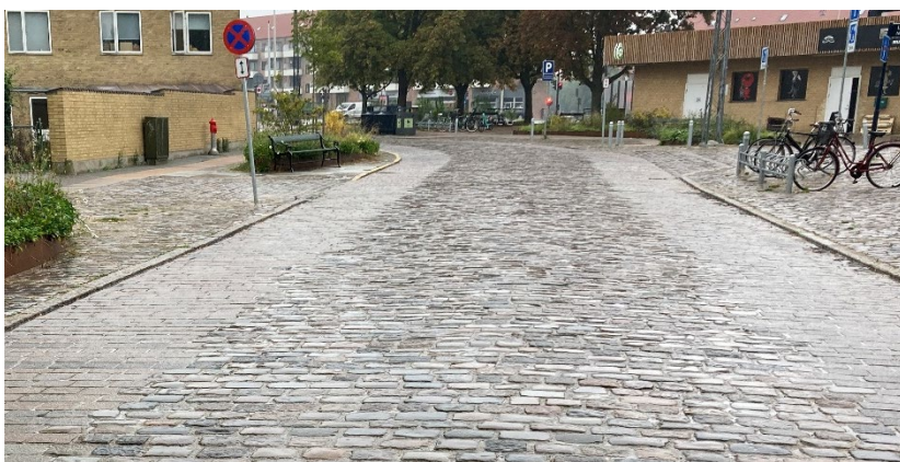
Billede 5: Eksempel på hvordan brostenene vil se ud