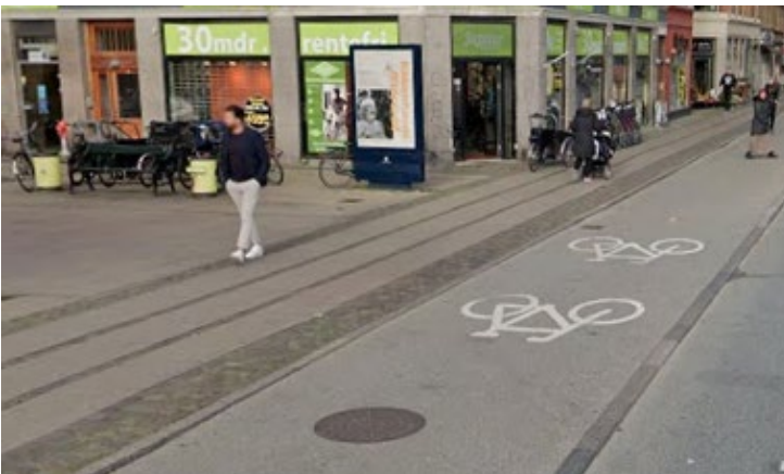
Billede 2: Eksempel på gennemført fortov og cykelsti

Ved sidevejene Gaunøvej, Svenstrupvej og Vemmetoftevej bliver fortovet ført igennem, sådan at det er cyklister og forgængere, der bliver prioriteret på Vejlegårdsvej.