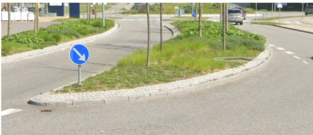
Billede 4: Midterhellen ved Egholmskolen

Bedene ved Risingeparken og Torbenfeldvej bliver etableret i samme stil som midterhellen på Vallensbæk Stationstov ved Egholmskolen.