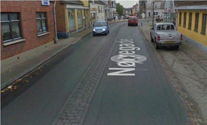
Billede 1: Eksempel på et brostensbånd

Hastighedsgrænsen bliver sat ned til 40 km/t. Dette forudsætter at politiet giver samtykke til dette.